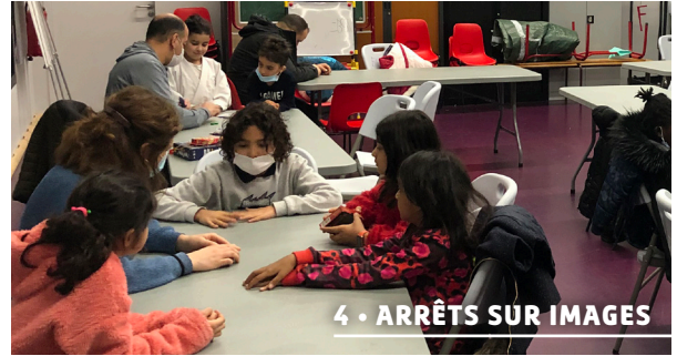
4 • ARRÊTS SUR IMAGES

DOSSIER VRAI / FAUX CADRE DE VIE VITE-DITS TRIBUNES