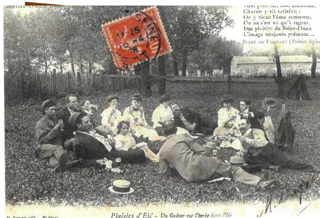
Enfants et adultes, femmes et hommes... Tout le monde vient à la guinguette !