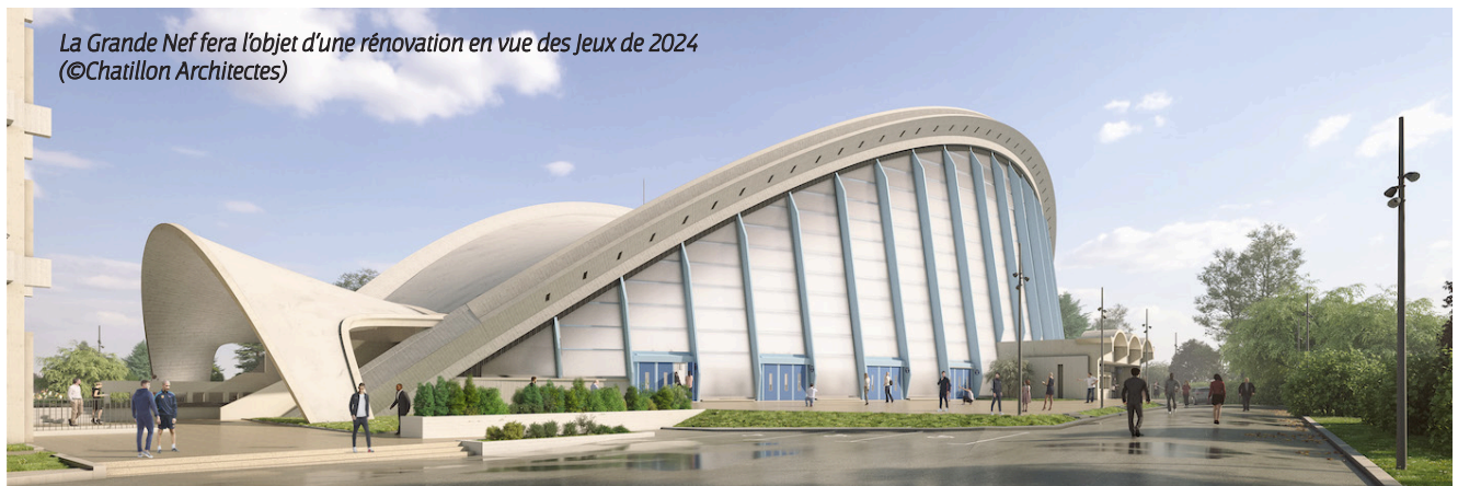
La Grande Nef fera l'objet d'une rénovation en vue des Jeux de 2024 (©Chaillion Architectes)

Le 26 janvier dernier, le conseil municipal adoptait en réponse un vœu, rappelant que l'île-des-Vannes est bel et bien située à L'Île-Saint-Denis, et que toute modification d'urbanisme ne peut se faire sans respecter le Plan Local d'Urbanisme Intercommunal et le projet municipal flodionysien. Ce dernier ne prévoyant ni de nouvelles constructions, ni la densification de l'île-des-Vannes, mais privilégiant plutôt la mise en place d'un grand parc urbain sportif et ouvert à tou(te)s, l'incertitude est encore de mise pour ce qui est de l'avenir du complexe. La réflexion est en cours pour permettre la réalisation d'un projet qui devra répondre aux exigences de la ville et aux attentes des habitants.