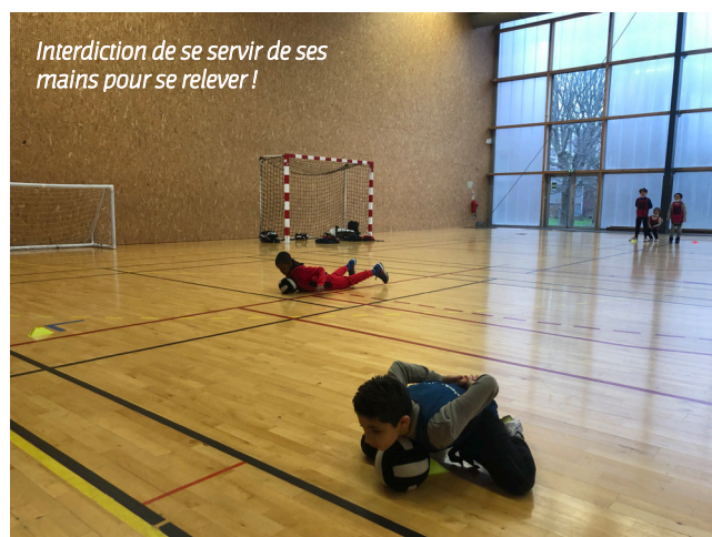
Interdiction de se servir de ses mains pour se relever !