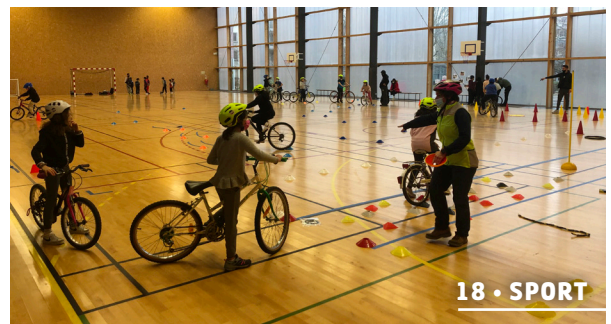
18 • SPORT