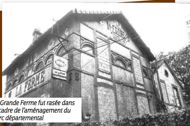
La Grande Ferme fut rasée dans le cadre de l'aménagement du parc départemental

Un siècle plus tard, tous ces noms, auxquels on pourrait ajouter le Chat qui fume ou le moulin de Cage , ne sont plus que des souvenirs. Mais des souvenirs vivants de ce qui fut la vie de nos ancêtres pas si lointains.