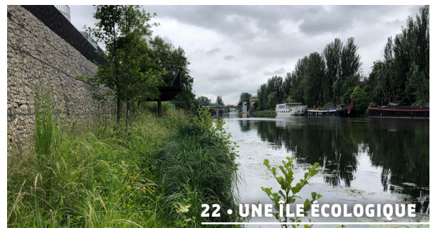
22 • UNE ÎLE ÉCOLOGIQUE