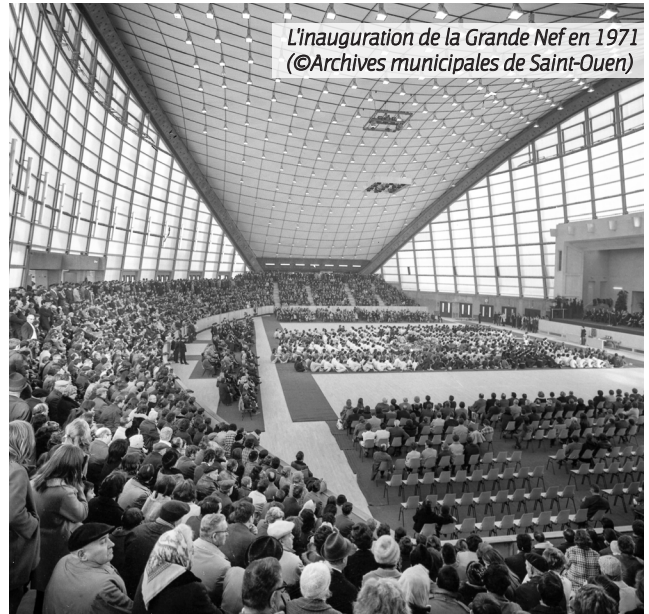
L'inauguration de la Grande Nef en 1971

Le 19 janvier dernier, la Ville de Saint-Ouen confirma en effet dans la presse le projet d'une « Tony Parker Academy », centre de