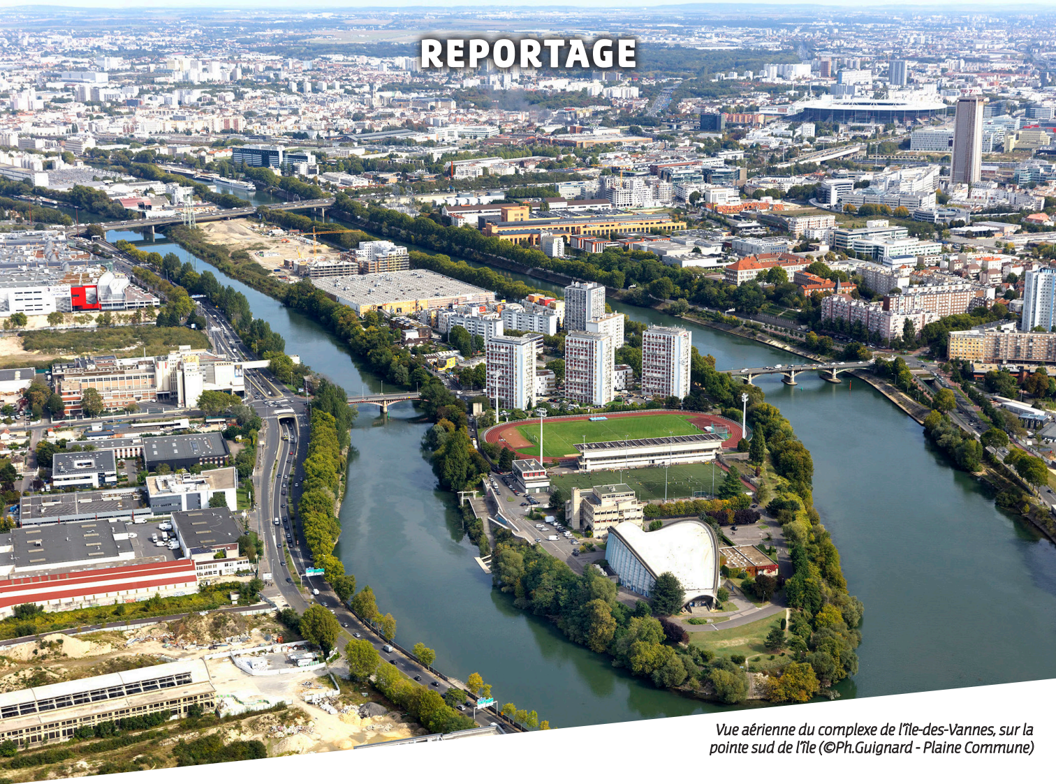
Vue aérienne du complexe de l'île-des-Vannes, sur la pointe sud de l'île