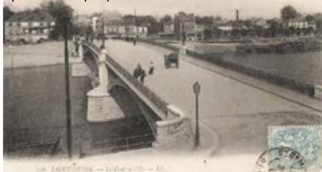
Le pont de L'Île-Saint-Denis en 1906, un an après avoir été reconstruit pour des raisons pratiques et sécuritaires