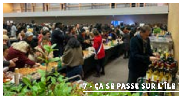
7 • ÇA SE PASSE SUR L'ÎLE