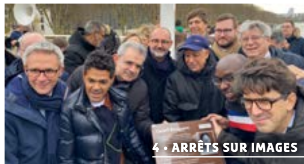
4 • ARRÊTS SUR IMAGES