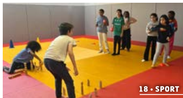
18 • SPORT