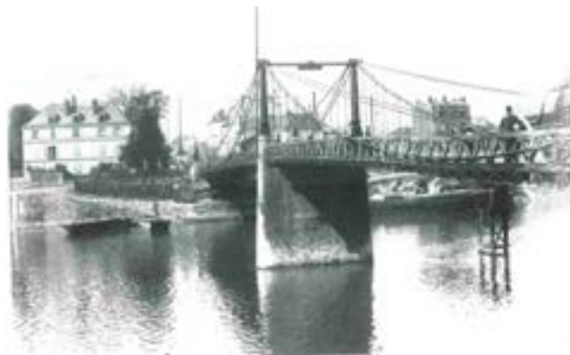
Le premier pont construit en 1843 par les frères Seguin

Il y a fort à penser que le feu vert donné par les autorités s'inscrivait dans un contexte général de développement du réseau routier qui dépassait de loin les seuls intérêts des Îlodionysiens, dans