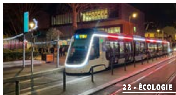
22 • ÉCOLOGIE

Suivez l'actualité de votre ville : www.lile-saint-denis.fr