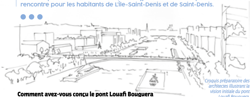
Croquis préparatoire des architectes illustrant la vision initiale du pont Louafi Bouguera.