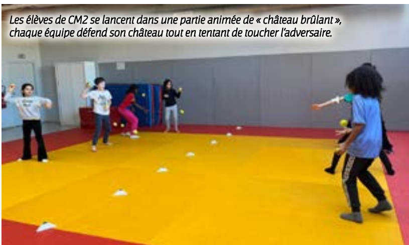
Les élèves de CM2 se lancent dans une partie animée de « château brûlant », chaque équipe défend son château tout en tentant de toucher l'adversaire.